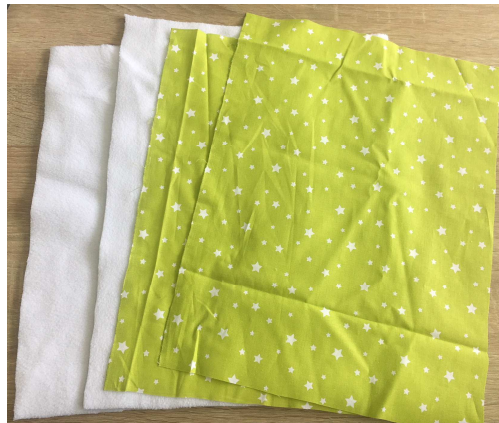
mes 4 rectangles de tissus

A la fin de cette étape vous devez avoir 4 rectangles (2 de 28*38 et 2 de 30*40).